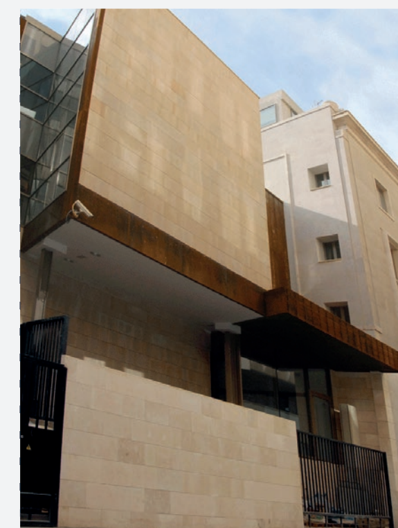
BANCO DE ESPAÑA, CASTELLÓN

Contamos con una sólida trayectoria en valoraciones de inmuebles y otros derechos, así como otro tipo de informes relacionados con la propiedad inmobiliaria. Se trata de una actividad en la que ofrecemos un servicio único, debido a nuestra alta especialización en el patrimonio del sector público, cuya problemática está muchas veces fuera del tráfico inmobiliario estándar.