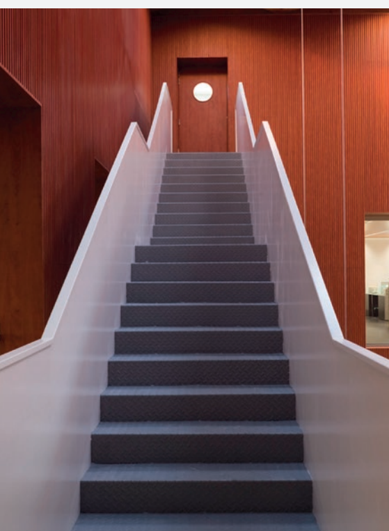
BANCO DE ESPAÑA, LEÓN