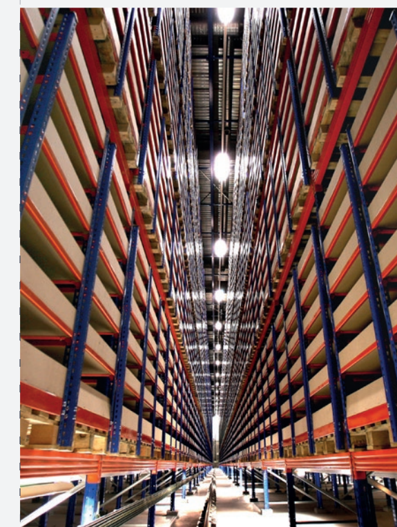
CADA, LAS ROZAS