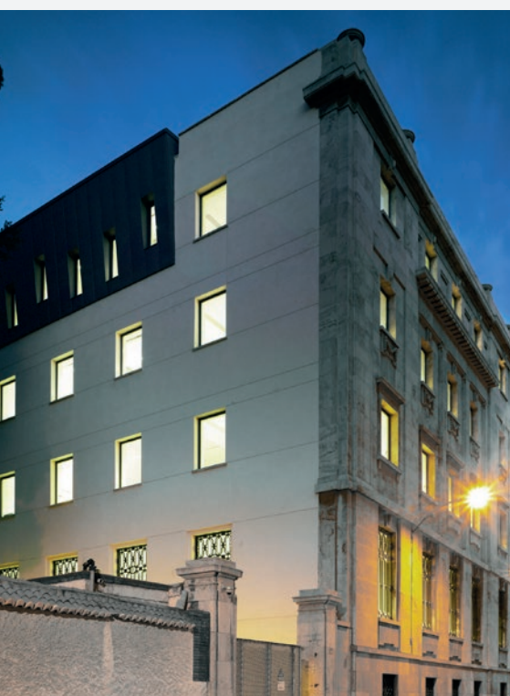
BANCO DE ESPAÑA, ALMERÍA

SEGIPSA tiene el carácter de medio propio instrumental y servicio técnico para la realización de los trabajos de formación y mantenimiento del Catastro Inmobiliario. Desde 2005, la Dirección General del Catastro viene ininterrumpidamente encargando a SEGIPSA trabajos catastrales muy diversos, tanto a iniciativa propia como a solicitud y con la financiación de más de cincuenta diputaciones provinciales, cabildos insulares y ayuntamientos con los que tiene suscritos convenios de colaboración.