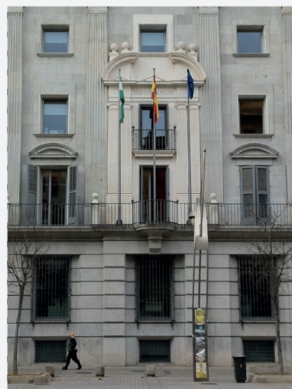
BANCO DE ESPAÑA, CÓRDOBA

SEGIPSA cuenta con la confianza de la Administración General del Estado para la mejora, modernización y rehabilitación energética de las Administraciones Públicas y para la conservación y puesta en valor del Patrimonio Histórico de uso Turístico.